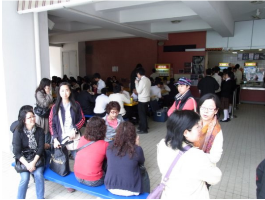
家長及委員在飯堂集合

三月十七日「學生關注組」邀請了各級家長進行了學生食物品質抽樣調查之試食活動，共有十名家長及委員出席。