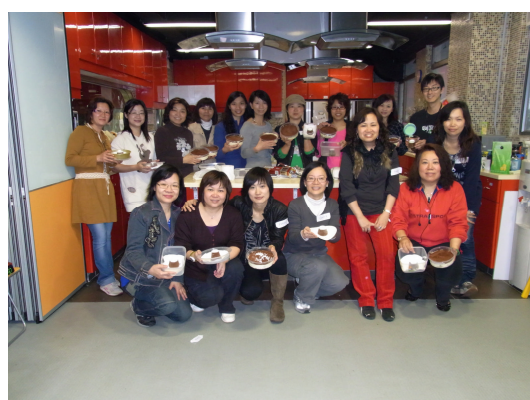
完成製作來個大合照