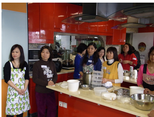
各家長用心聆聽導師講解