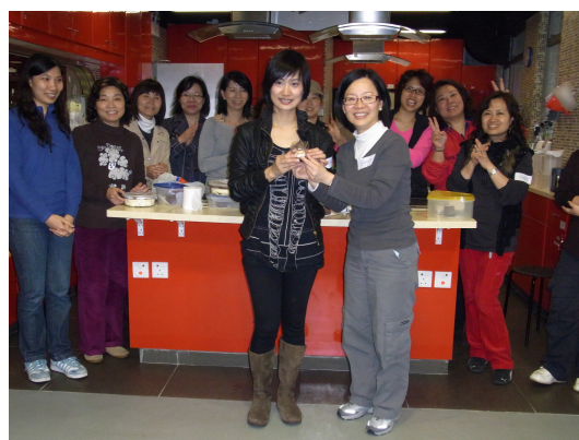
主席致送紀念品給義工家長導師