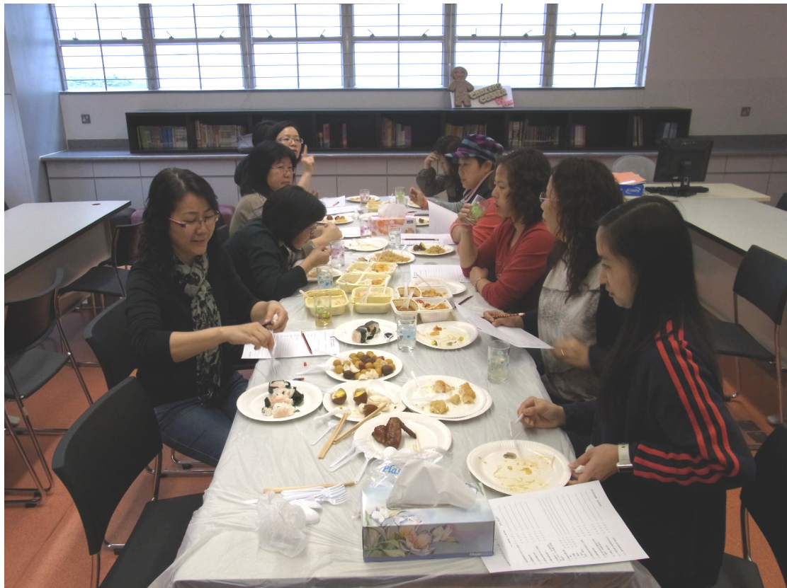
各家長及委員在試食後評分及給予意見