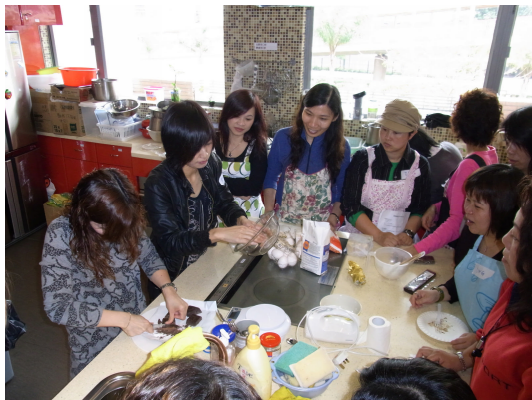
兩位義工家長導師悉心指導