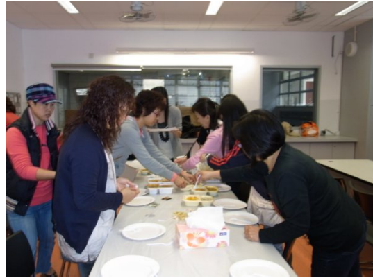
購買當天飯盒及小食、準備試食