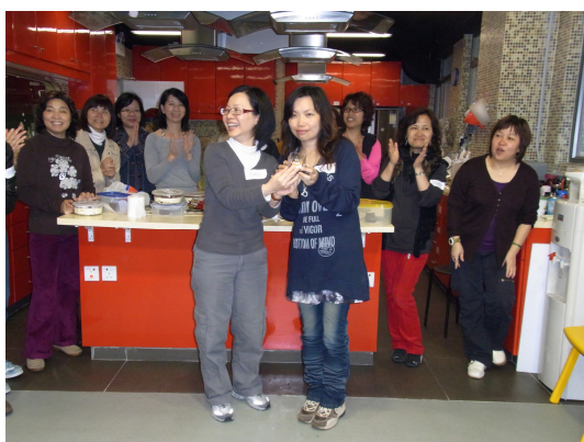
主席致送紀念品給義工家長導師